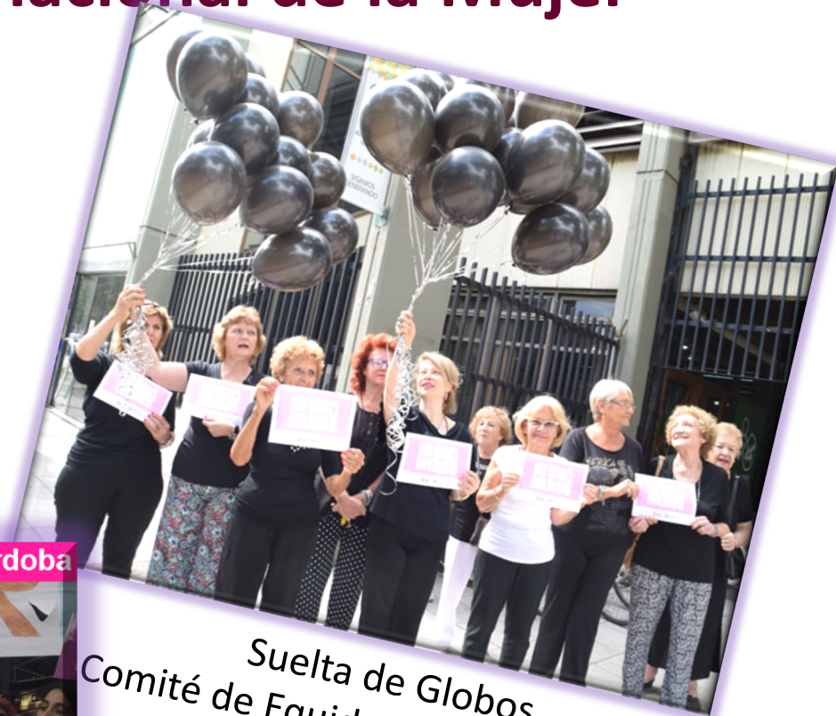
Suelta de Globos Comité de Equidad de Género de la Cooperativa Eléctrica Zárate