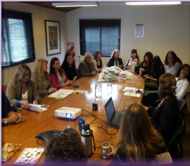
Secretaria de Genero Instituto Movilizador de Fondos Córdoba